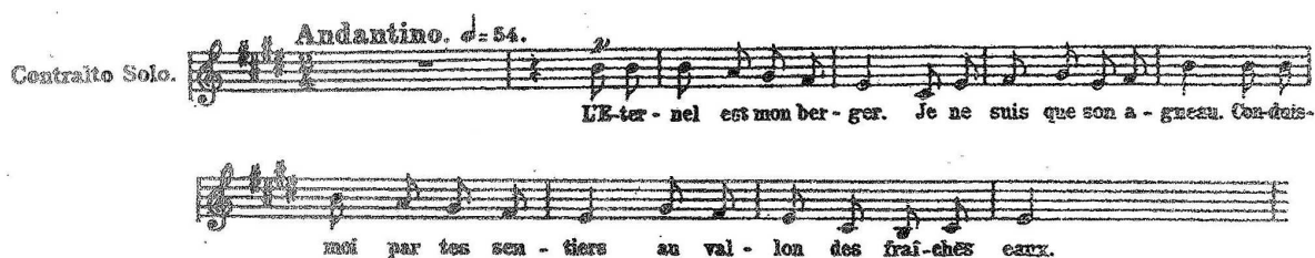
Fig. 1 – Contraalto Solo