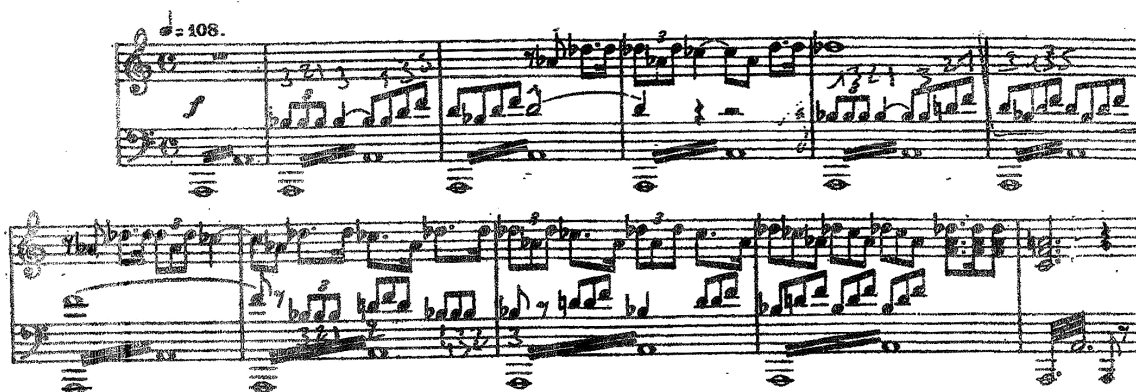
Fig. 3 – Fanfare / Fanfară

Iată, în Valea terebinților, Saul a adunat oștile lui Israel împotriva Filistenilor.