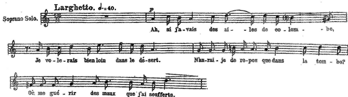
Fig. 8 – Solo Sopran – Psalmul lui David